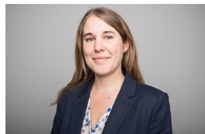
Anja Schuler Vizepräsidentin Schweizerischer Akkreditierungsrats